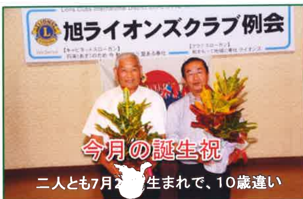
今月の誕生祝 二人とも7月生まれで、10歳違い