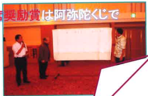
今年の出席奨励賞は阿弥陀くじで