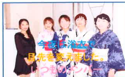
今夜は浴衣の 目先を変えました。 つものセンター