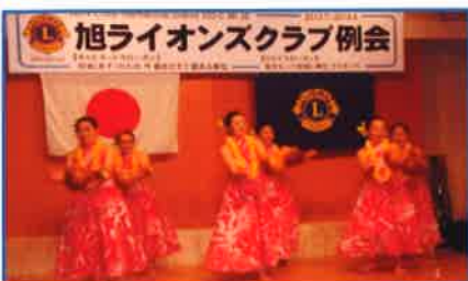
旭ライオンズクラブ例会