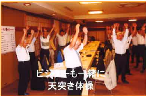
ビジターも一緒に 天突き体操