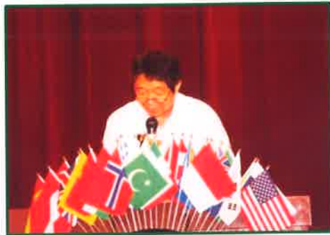
第47期収支決算報告 前会計 L林 清次