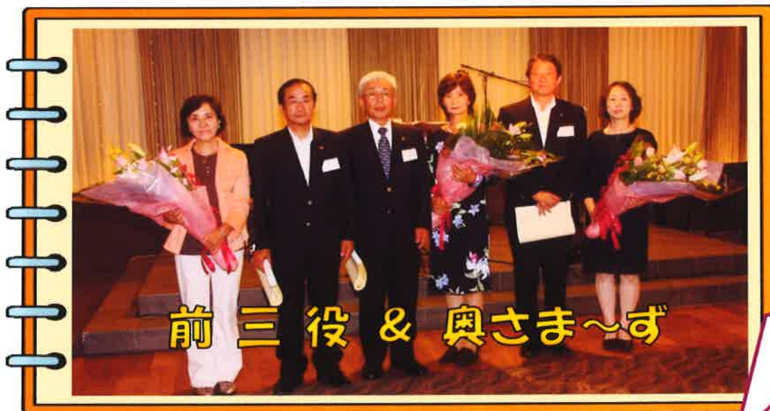
前三役 & 奥さま~ず