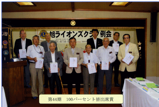
第44期 100パーセント皆出席賞