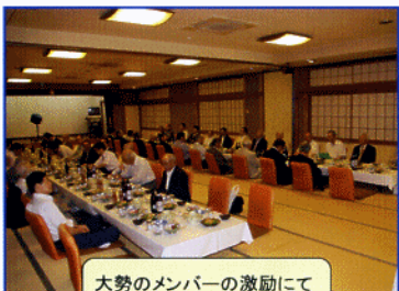
大勢のメンバーの激励にて 今年度はスタート