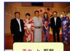
美女 と 野獣