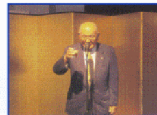
乾杯 元ZC L向後金治