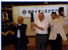
出席奨励賞(委員会賞)