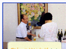
生ビールはいかが!!