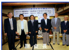
副 会 長