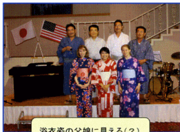
浴衣姿の父娘に見える(?)