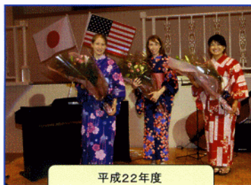
平成22年度 外国語指導助手