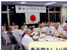
恵天堂さんより沢山の接待をうけました