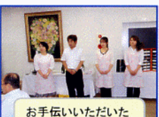
お手伝いいただいた 恵天堂スタッフの皆さん