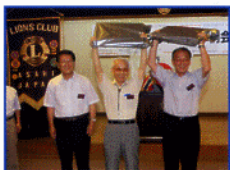
出席奨励賞(会長賞)