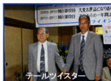
テールツイスター