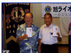
平成21年度ゴルフ部 優秀賞受賞