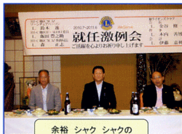
余裕 シャク シャクの スタートか？