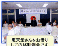
恵天堂さんをお借り しての移動例会です