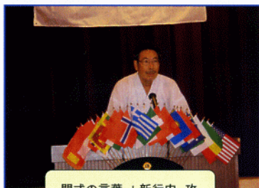
閉式の言葉 L新行内 攻