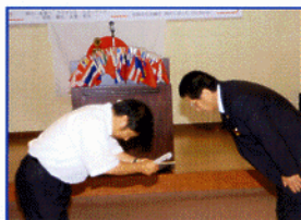
旭市児童科学作品展・図工美術夏季作品展の助成