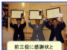
前三役に感謝状と 記念品の贈呈