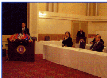
担当 青少年委員長 L新行内 攻