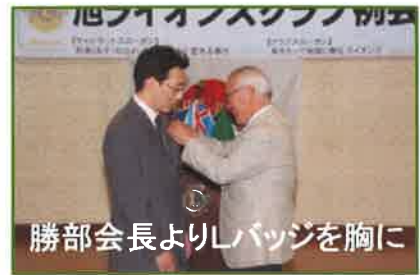
勝部会長よりLバッジを胸に