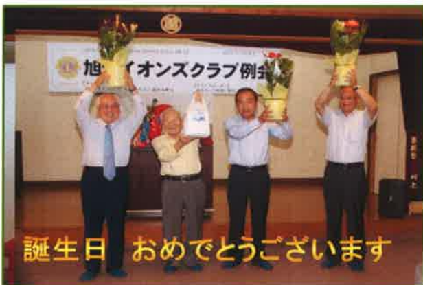
誕生日 おめでとうございます