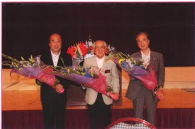
一年間ご苦労様でした