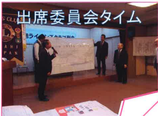
出席委員会タイム