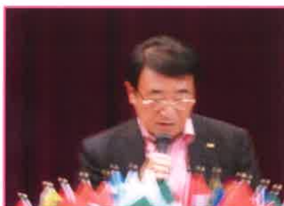
国際協調YCE委員長 L伊藤和則 YCE夏季派遣生募集 について