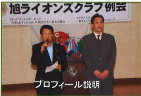
プロフィール説明