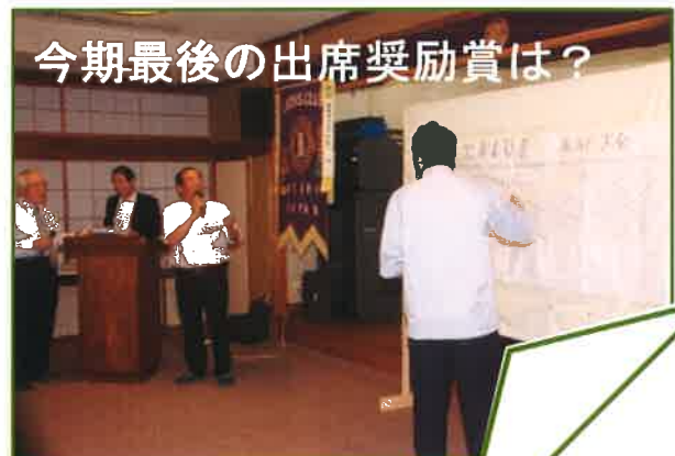
今期最後の出席奨励賞は？