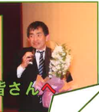
今月の誕生プレゼントは茅野LCの皆さんへ