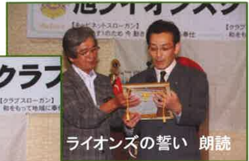
ライオンズの誓い 朗読