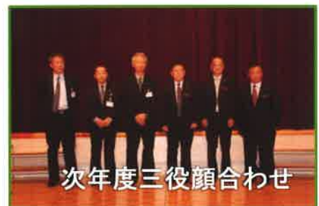
次年度三役顔合わせ