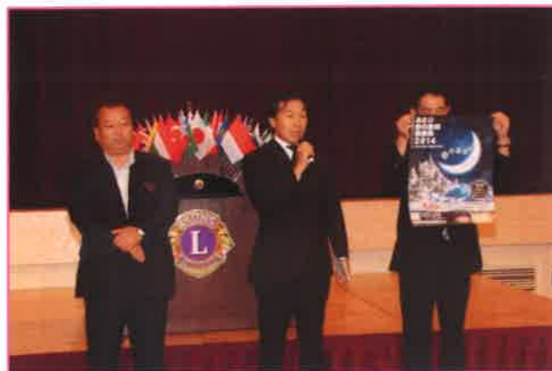
砂の彫刻美術展実行委員会へ 助成金の贈呈