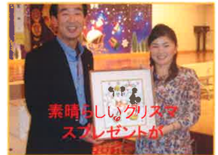
素晴らしいクリスマスプレゼントが