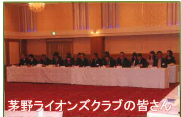
茅野ライオンズクラブの皆さん