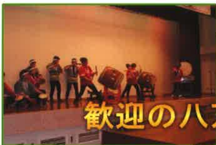
歓迎の八万高太鼓